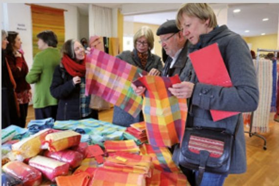
Viele Besucher des Herbstmarkts interessieren sich für die Produkte aus der Lautenbacher Weberei.

Im Wilhelm Meister Saal, wo nachmittags die Lautenbacher Blaskapelle zur Unterhaltung aufspielte, gab es köstliche Speisen aus Produkten der dorfeigenen Landwirtschaft. Alternativ dazu konnten die Gäste auch in der Tonwerkstatt Holzofenpizza oder beim Lautenbacher Bauernhof Bratwurst und Pommes essen. Der heiße Früchtepunsch der Gärtnerei und der Kräutertee aus der Teewerkstatt fanden insbesondere bei den kühlen Temperaturen reißenden Absatz.