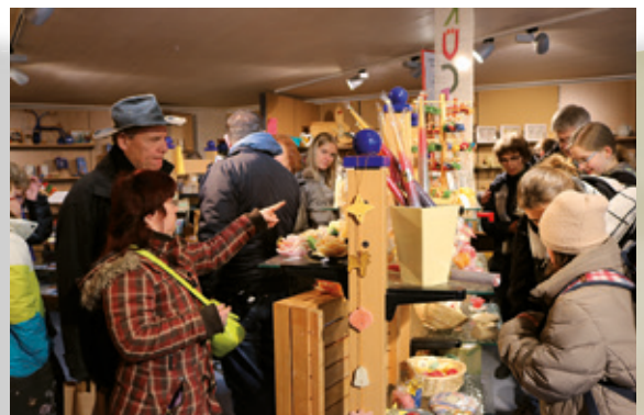
Die Produkte der Lautenbacher Werkstätten erregen beim Herbstmarkt das Interesse der Besucher. Im Lädlele finden sie viele Anregungen für Geschenke.